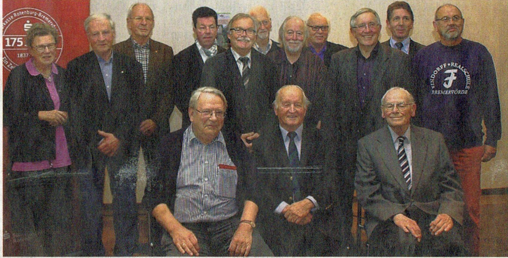
Die Arbeitsgruppe Stadtgeschichte und die Autoren des Bremervörder Jahrbuchs 2012 freuen sich über ihr gemeinsames Werk.