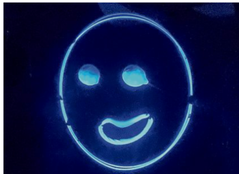
Die Dunkelheit gebiert ein Lächeln – gestaltet vom Schwarzlichttheater Bremen, dessen schwarz gekleidete Akteure für das Publikum unsichtbar sind.

wabernd Schuberts Figuren Leben einhaucht.